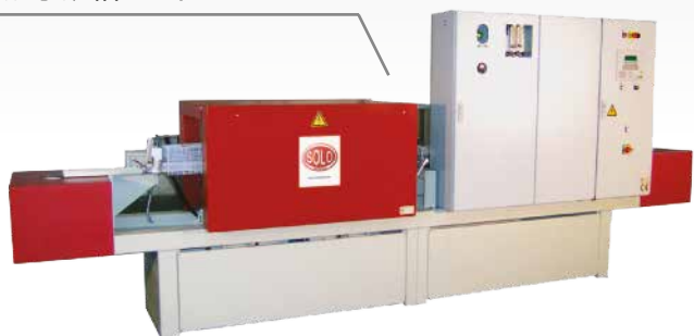
炉子规格 10 / 80 C