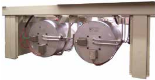
2台整体式氨裂解炉