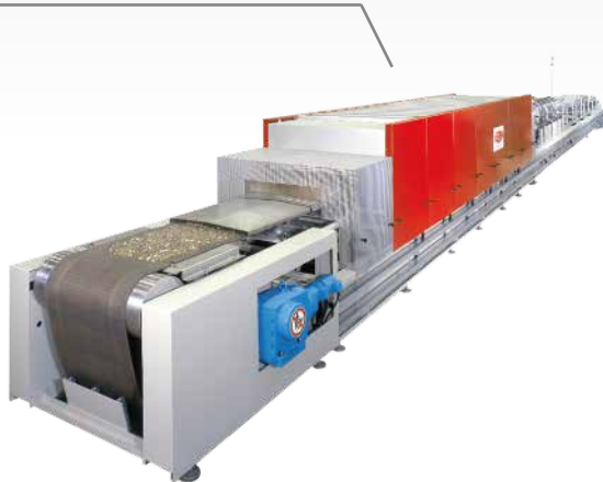
炉子规格 80 / 600