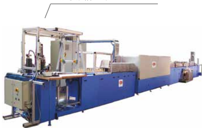
炉子规格 30 / 300