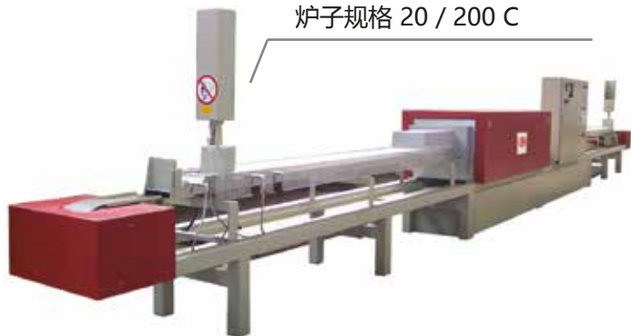
炉子规格 20 / 200 C